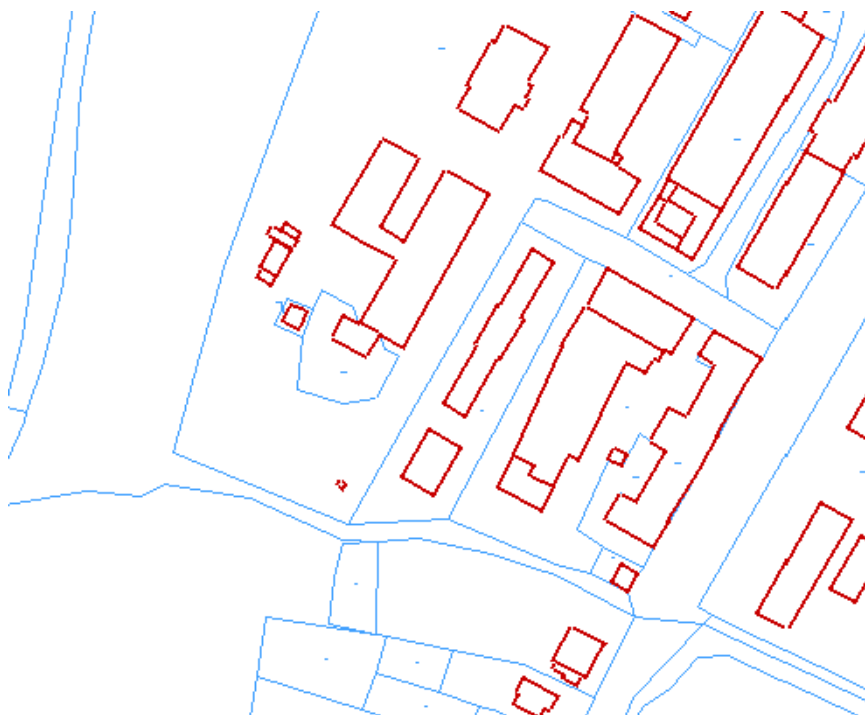
Fot. 2: mapa